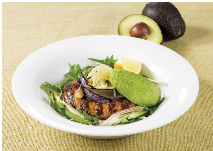
香味野菜のアボカドハンバーグ 899 円 (税込 970 円)

肉汁をたっぷりと閉じ込めたふっくら柔らかな合挽きハンバーグのさっぱり夏仕立て。生姜、みょうが、大葉などの香味野菜と、なめらかな食感のアボカドをトッピング。酸味と甘みのバランスが良い黒酢入り生姜醤油ソースで仕上げました。添えてあるレモンを絞ればさらにさっぱりとした印象になります。