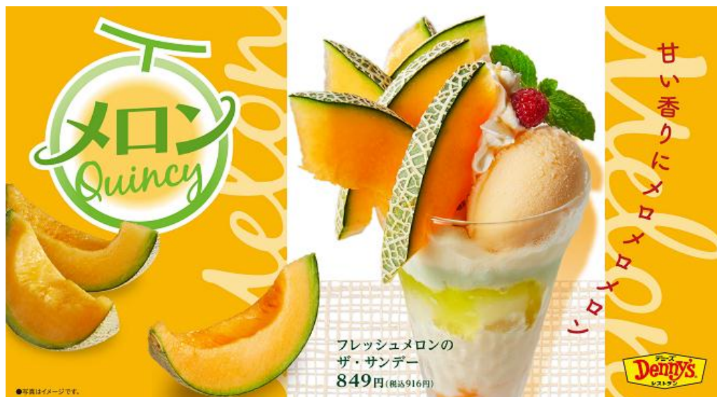
フレッシュメロンのザ・サンデー 849円(税込916円)

旬をむかえたフレッシュなメロンだけでなく、メロンソースにメロンチョコクリーム、メロンソルベとサンデーを構成する素材でもメロンの甘みと香りを楽しめます。さらに、全体の味わいに変化をあたえるヴェルヴェーヌゼリーやマスカルポーネクリームなど、ひとつひとつの素材がメロンの美味しさを引き立てます。