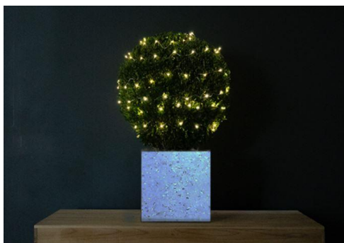
【ボタニカルライト鉢】

「ダヴ」の空ボトルをブランドのシンボルである鳩のかたちのLEDランプにリサイクルしたものです。ライトダウンした店内テーブルの演出に活用します。